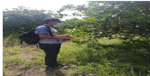
Figura 5. Toma de muestras de psílicos en huertas comerciales