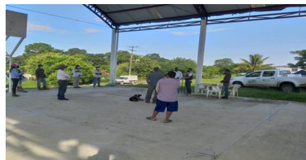
Figura 7. Talleres participativos a productores sobre síntomas de plagas reqlamentadas de los cítricos

d) Entrenamiento: Con el propósito de difundir la estrategia operativa de la Campaña, así como la sensibilización hacia los productores sobre la importancia de las enfermedades y adopción de las acciones mediante el establecimiento de AMEFIs, se realizaron 4 Talleres Participativos en los Municipios de Fco. Z, Mena y Pantepec, correspondientes a la Región Sierra Norte; Acateno y Hueytamalco, correspondientes a la Región Sierra Nororiental. Con esta acción se benefició un total de 42 productores.