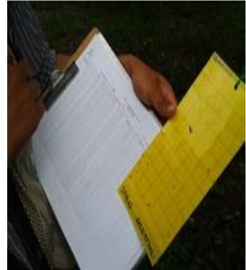
Figura 2. Trampas establecidas para el monitoreo del PAC.

El promedio de diaforinas obtenido en el mes de febrero fue de 2.14 diaforinas/trampa/mes