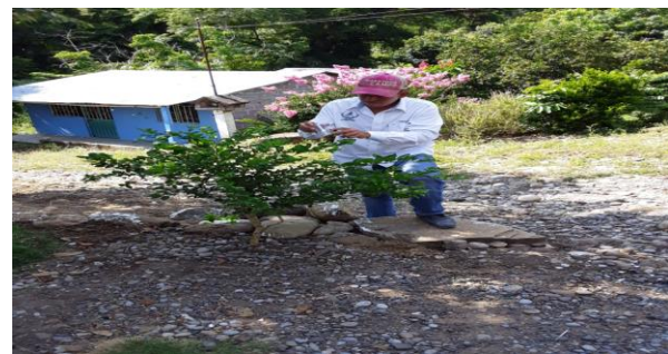
Figura 6. Toma de muestras de psílicos en rutas urbanas

d) Entrenamiento: Con el propósito de difundir la estrategia operativa de la Campaña, así como la sensibilización hacia los productores sobre la importancia de las enfermedades y adopción de las acciones mediante el establecimiento de AMEFIs, se realizaron 4 Talleres Participativos en los Municipios de Fco. Z, Mena y Pantepec, correspondientes a la Región Sierra Norte; Acateno y Hueytamalco, correspondientes a la Región Sierra Nororiental. Con esta acción se benefició un total de 42 productores.