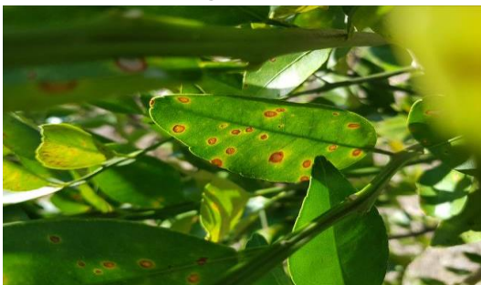
Figura 3. Exploración para detección de síntomas de Leprosis

No se detectaron plagas de interés cuarentenario